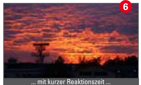
6 ... mit kurzer Reaktionszeit ...