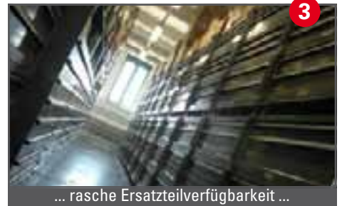
3 ... rasche Ersatzteilverfügbarkeit ...