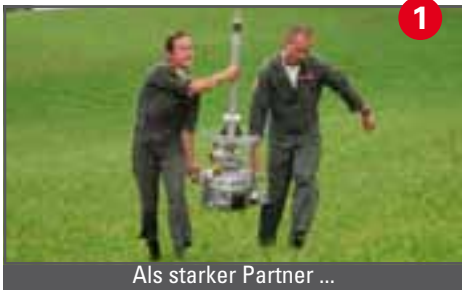
1 Als starker Partner ...