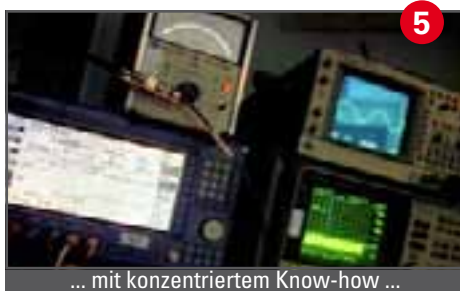
5 ... mit konzentriertem Know-how ...