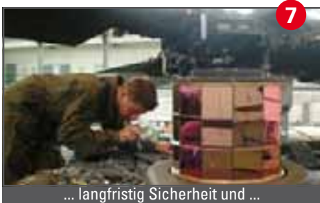
7 ... langfristig Sicherheit und ...