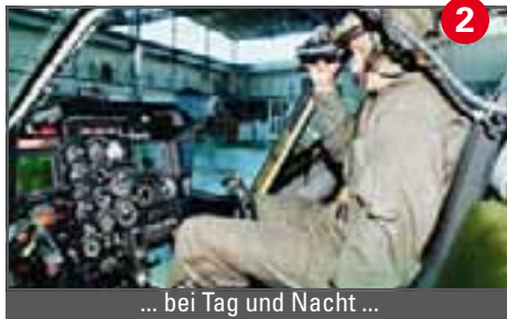
2 ... bei Tag und Nacht ...