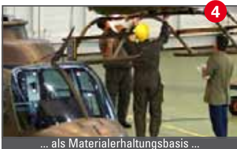
4 ... als Materialerhaltungsbasis ...